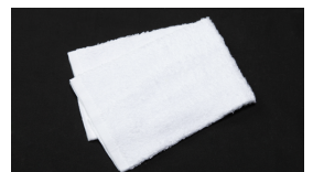
補整用タオル 1本 (薄手のもの)