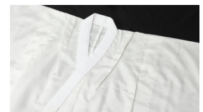
長襦袢 (かならず半襟をつけてお持ちください)